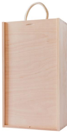
SKRZYŃKA 2BUT PIÓRNIK 320x180x95