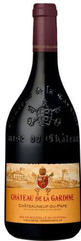
Chateaufeuf Du Pape Rouge Chateau De La Gardine 2020

Apelacja: AOC Chateaufeuf du Pape Kraj: Francja Region: Dolina Rodanu Producent: Chateau Brunel De La Gardine Kolor: Czerwone Smak: Wytrawne Poj.: 0.75 Zaw. Alk. %: 15.0 Rocznik: 2020