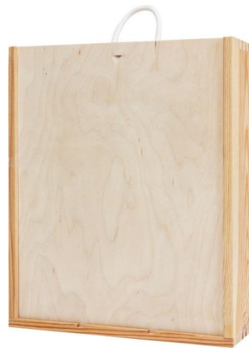
SKRZYŃKA 3BUT PIÓRNIK 320x270x95