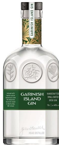
Garnish Island Gin

Kraj: Irlandia Region: Producent: West Cork Poj.: 0.7 Zaw. Alk. %: 46.0