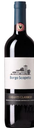
Borgo Scopeto Chianti Classico 2017

Apelacja: DOCG Chianti Classico Kraj: Włochy Region: Toskania Producent: Caparzo Kolor: Czerwone Smak: Wytrawne Poj.: 0.75 Zaw. Alk. %: 13.0 Rocznik: 2017