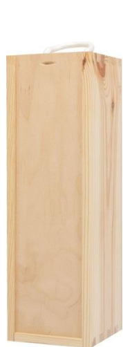
SKRZYŃKA 1BUT PIÓRNIK 320x95x95

Polecamy również opakowania na wina i alkohole, oraz dodatki w formie wysokiej jakości czekolad, przekąsek i oliw.