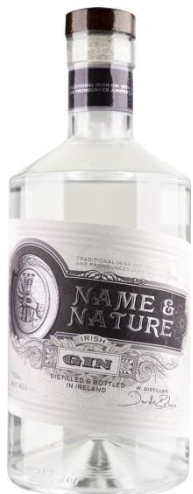
NAME & NATURE Gin 0,7

Kraj: Irlandia Region: Producent: West Cork Poj.: 0.7 Zaw. Alk. %: 40.0