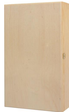
SKRZYŃKA NA 2BUT OTWIERANA Z GÓRY