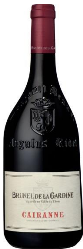
Cairanne Brunel De La Gardine 2020

Apelacja: AC CAIRANNE Kraj: Francja Region: Dolina Rodanu Producent: Chateau Brunel De La Gardine Kolor: Czerwone Smak: Wytrawne Poj.: 0.75 Zaw. Alk. %: 15.0 Rocznik: 2020