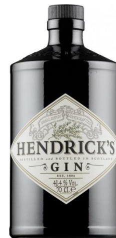
HENDRICK'S GIN 41,4% 0,7

Kraj: Szkocja Region: Poj.: 0.7 Zaw. Alk. %: 41.4